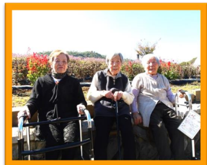
写真は、昨年の紅葉巡りドライブにおける丸子国際音楽村での情景写真です。