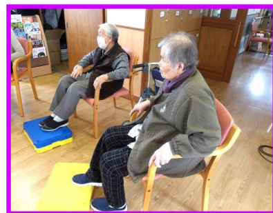
写真は、下肢機能訓練のご様子の画像です。