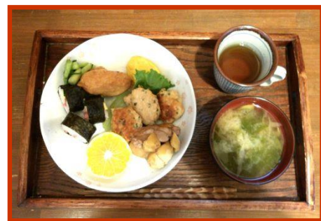
写真は、10月室内運動会でのお弁当定食の写真です。食べたら、元気でそうです！