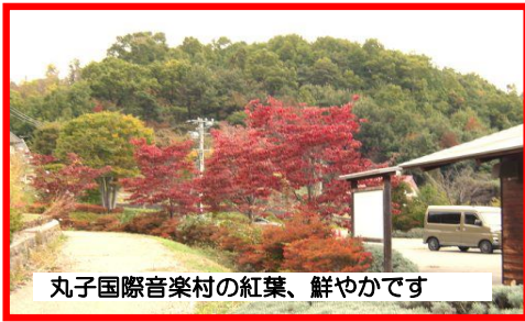
丸子国際音楽村の紅葉、鮮やかです